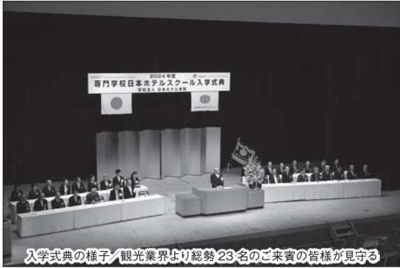
入学式典の様子 / 観光業界より総勢 23 名のご来賓の皆様が見守る

第 53 期入学式をなかの ZERO ホールにて 4 月 11 日 (木) に挙行了しました。昼間部国際ホテル学科 (ホテル科・英語専攻科・ホテル SNS コミュニケーション科・ブライダル科)、夜間部国際ホテル学科 (ホテル科・ブライダル科) に総数 222 名が入学しました。入学式では保護者、ご家族の皆様約 140 名、観光関係団体、企業、教育関係者計 23 名のご来賓の見守る中、石塚校長より式辞、観光関係団体、企業、教育関係者のご来賓を代表し、一般社団法人日本ホテル協会専務理事掛江浩一郎様より祝辞をいただきました。