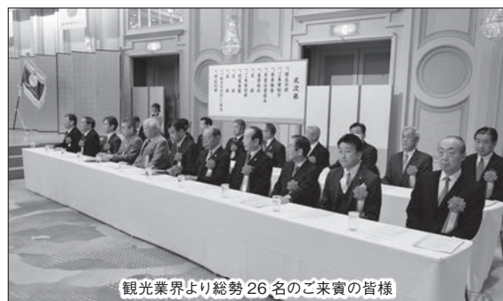
観光業界より総勢26名のご来賓の皆様

式典終了後は、クラスごとの担任からの修了証書授与、卒業記念パーティーが行われました。