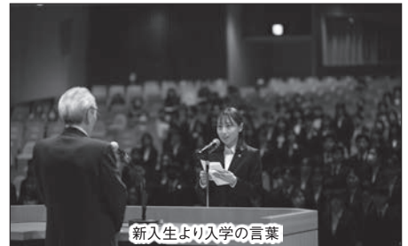
新入生より入学の言葉