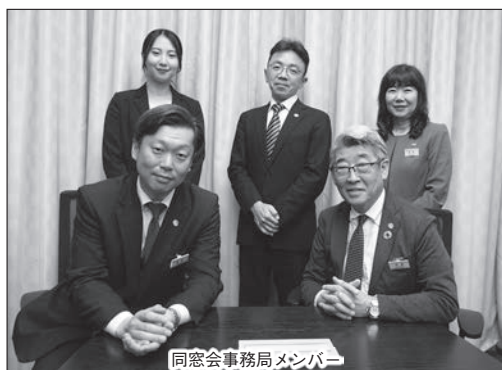
同窓会事務局メンバー