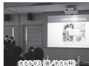
ホテルゼミ(夜/ホテル科)