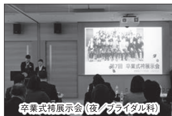
卒業式精展示会(夜/ブライダル科)

レストラン開業を目的として各チームが立地を設定し、事業計画を立案。プロジェクトリーダー、経理、商品マネージャー、マーケティングマネージャーなど必要な職種をチームごとに決め役割を担います。投資家として審査を行う講師に対してプレゼンテーションを行います。