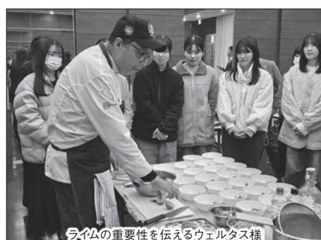
ライムの重要性を伝えるウェルタス様