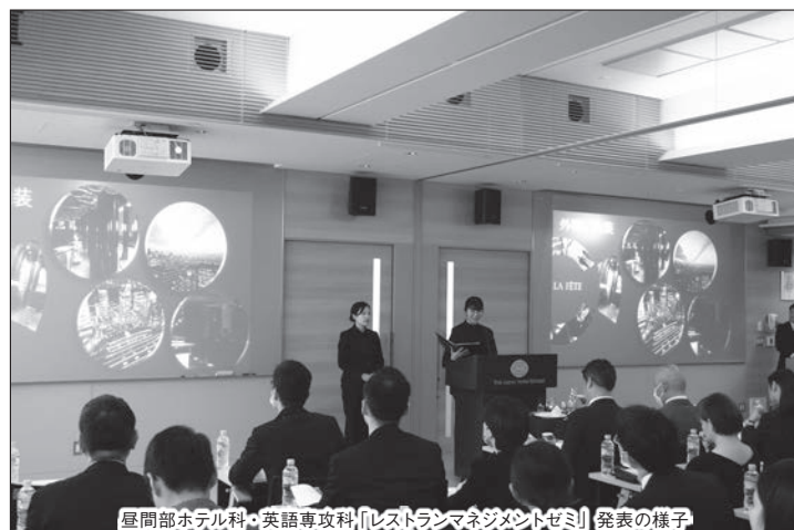
昼間部ホテル科・英語専攻科「レストランマネジメントゼミ」発表の様子