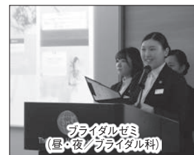
ブライダルゼミ(昼・夜/ブライダル科)