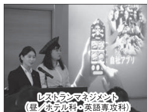
レストランマネジメント(昼/ホテル科・英語専攻科)