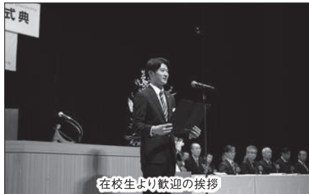
在校生より歓迎の挨拶