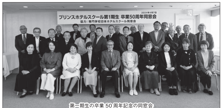
第一期生の卒業 50 周年記念の同窓会

50年を経て、70歳台になった第一期生の同窓会に参加して、在学中の協力、卒業後の活躍には感謝を、そして、第一期生と苦楽を共にしただけに、50周年記念同窓会には感慨深いものがありました。