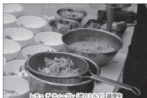
レビュ デティエーグレ(虎のミルク) 調理中