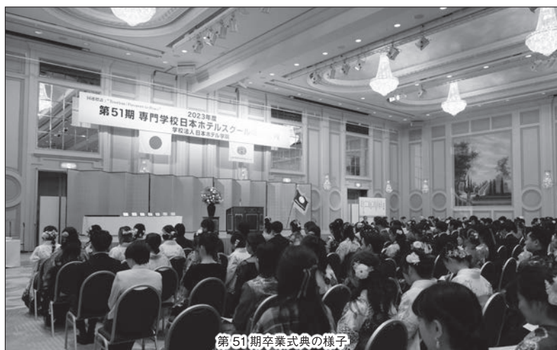
第51期卒業式典の様子