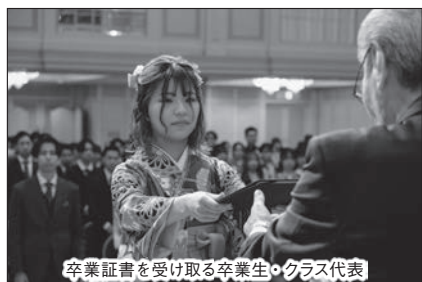
卒業証書を受け取る卒業生・クラス代表

観光業界を代表する26名のご来賓をお迎えし、保護者の皆様が見守る中で卒業証書を授与