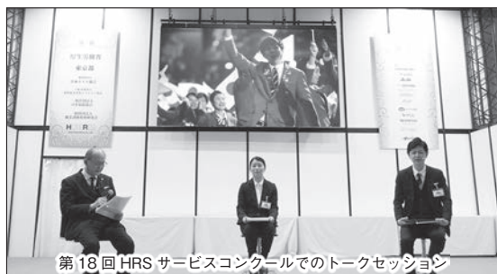
第18回HRS サービスコンクールでのトークセッション