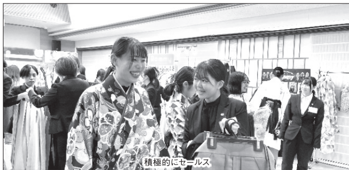
積極的にセールス

夜間部ブライダル科2年生による産学連携の授業「卒業式袴展示会」を10月4日から10月6日の3日間で開催しました。これは協賛企業である衣裳系企業「株式会社マйм」「株式会社曾我」2社と連携し、学生主体で2年生が卒業式で着用する袴やタキシードの展示会を学校内で行うという2016年度から続けている産学連携の取り組みです。卒業式袴展示会の運営を通して、有効顧客の把握、売上目標の設定、集客方法、展示会説明、接客・成約というマネジメントの視点を学ぶことを目的としています。