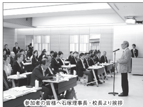
参加者の皆様へ石塚理事長・校長より挨拶

新校舎の内覧、および人事担当・実習担当の皆様と本校の教職員との懇親会を行い、情報交換や親睦を深める機会となりました。