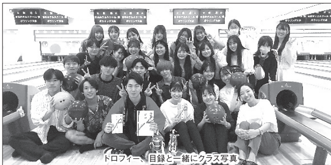
トロフィー、目録と一緒にクラス写真

2023年9月25日、品川プリンスホテル アネックスタワーのボウリングセンターで、2年生対象の『ボウリング大会』が開催されました。この時期は進路もある程度決まり、学校生活をより楽しむ絶好の機会。大会は、リラックスした雰囲気の中で行われました。