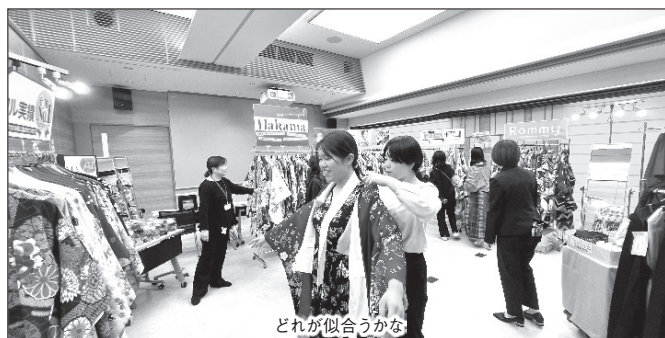
どれが似合うかな