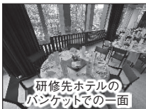
研修先ホテルのバンケットでの一面