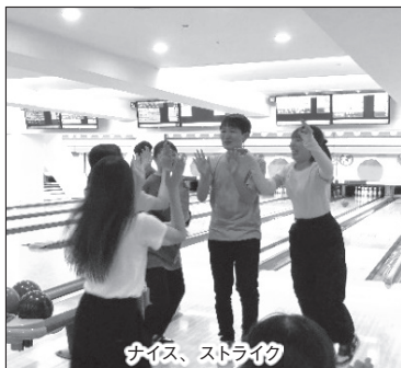
ナイス、ストライク