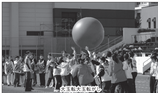
大玉転大玉転がし