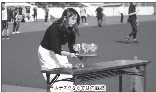
ホテスクならではの競技