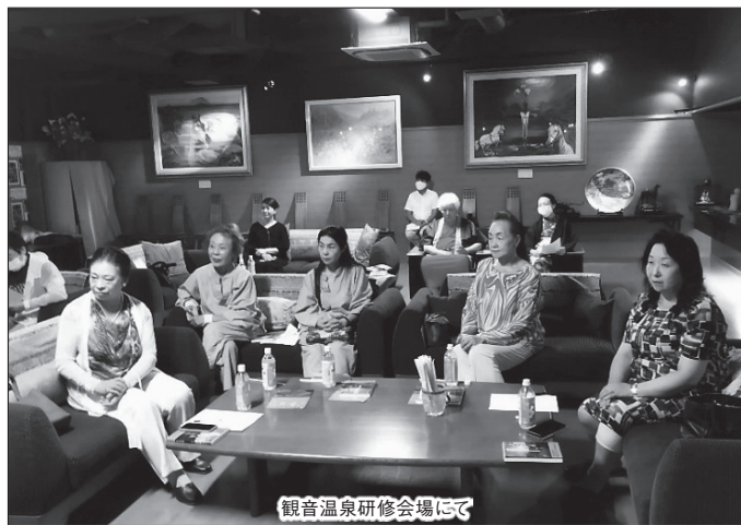
観音温泉研修会場にて